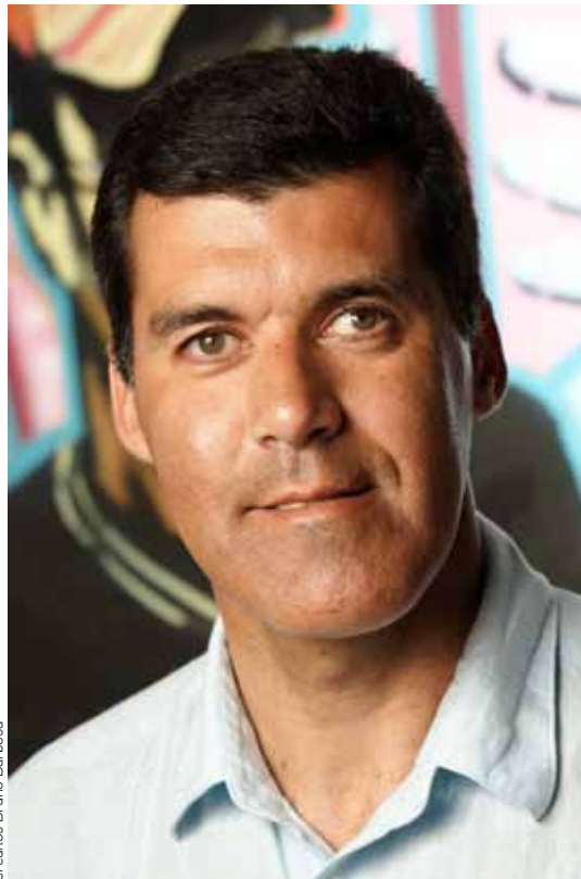
Créditos Bruno Barbosa