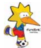
Futebol 5 Football 5-a-side