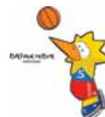
Basquetebol em Cadeira de rodas Wheelchair Basketball