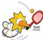
Ténis em Cadeira de rodas Wheelchair Tennis