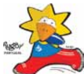
Rugby em Cadeira de rodas Wheelchair Rugby